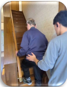
実際の階段を使っ ての昇降訓練

職員がしっかりサポートするので楽しみながら買い物！。生活リハで自信を取り戻します！